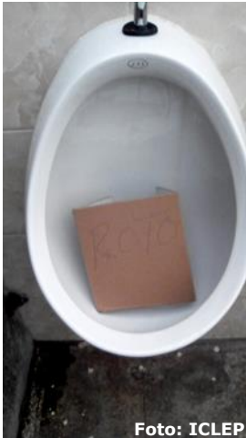
Inodoro roto en el baño del centro mencionado.