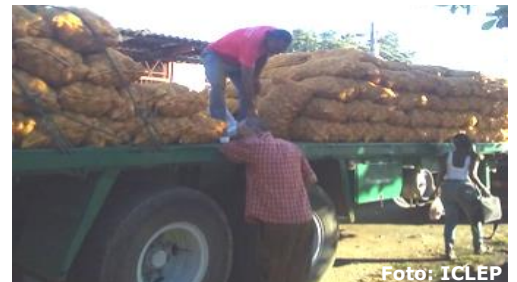
Momento en que bajaban las papas.