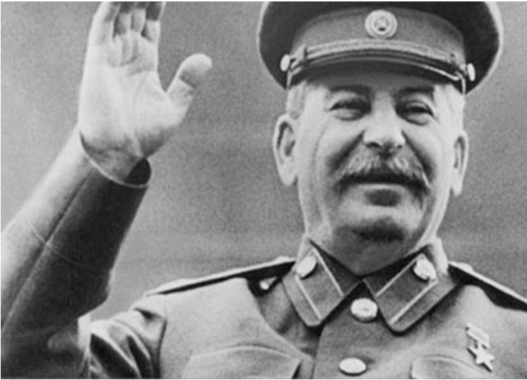
Joseph Vissarionovich Stalin

Mito #5: Stalin fue el gran dictador que inició un régimen de terror para retener el control del poder Comunista.