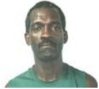
Por: Eliosbel Garriga Periodista ciudadano