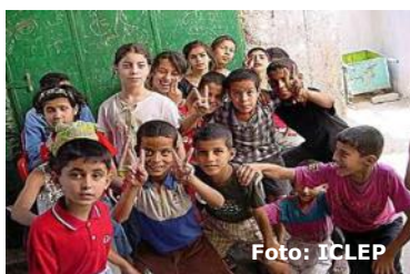
Grupo de infantes.

La Declaración de Ginebra sobre los Derechos del Niño es el primer texto histórico que reconoce la existencia de derechos específicos para las niñas y niños, además de la responsabilidad de las personas adultas sobre su bienestar. Los derechos del niño son un conjunto de normas de derecho internacional que protegen a las personas hasta determinada edad. Todos y cada uno de los derechos de la infancia son inalienables e irrenunciables, por lo que ninguna persona puede vulnerarlos o desconocerlos bajo ninguna circunstancia. 10 artículos hacen referencia a los siguientes derechos: El derecho a la igualdad, sin distinción de raza, religión, idioma, nacionalidad, sexo, opinión política, el derecho a tener una protección especial para el desarrollo físico, mental y social, el derecho a un nombre y a una nacionalidad desde su nacimiento, el derecho a una alimentación, vivienda y atención médica adecuada, el derecho a una educación y a un tratamiento especial para aquellos niños que sufren alguna discapacidad mental o física, el derecho a la comprensión y al amor de los padres y de la sociedad, el derecho a actividades recreativas y a una educación gratuita, el derecho a estar entre los primeros en recibir ayuda en cualquier circunstancia, el derecho a la protección contra cualquier forma de abandono, crueldad y explotación y el derecho a ser criado con un espíritu de comprensión, tolerancia, amistad entre los pueblos y hermandad universal.