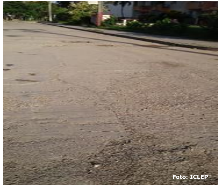
Hueco sellado, gracias a la insistencia de los colaboradores de Panorama Pinareño.