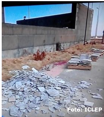
Imagen tomada en el norte de la provincia de Pinar del Río, después del paso de Irma.

En nuestro país, las personas deben proteger y asegurar sus viviendas con medios propios pues la mayoría de los cubanos tienen escasos recursos y regulares condiciones de vida para no lamentar los trágicos desastres de perderlo casi todo sin esperanzas de recuperar casi, nada.