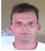
Por: Alexander Sánchez Cubano de a pie