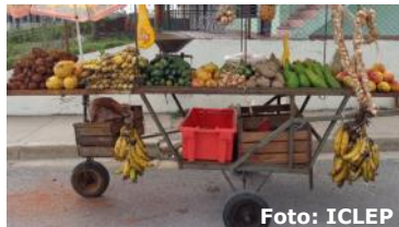
Carretilla particular abastecida con alimentos provenientes directamente del campo.

Pinar del Río, (ICLEP). Contaminados los productos agrícolas ofertados a la población por los llamados carretilleros, quienes aplican a dichos alimentos un químico para mantenerlos antes de tiempo. Este hecho afecta a un noventa y cinco por ciento de la población pinareña que los adquiere en dichos lugares, siendo los alimentos provenientes del campo los más necesitados para la alimentación humana. Desde que el gobierno puso a funcionar los puestos de venta de productos agrícolas en el país, se resolvieron muchos problemas con la alimentación sana que viene directamente de la naturaleza, los particulares comenzaron de inmediato a dar solución a ese gran problema que afectaba a la población cubana. Pero la avaricia de los carretilleros los ha llevado a utilizar métodos perjudiciales para la salud humana como el líquido madurador que emplean en la mayoría de los productos agrícolas.