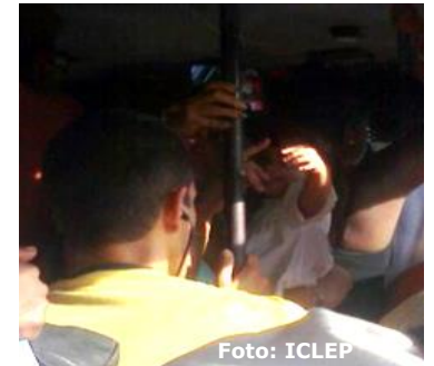
Ómnibus estatal repleto de personas.

todos, más para quienes tenemos que valernos a diario de él para ir a trabajar; a veces me levanto temprano y no vale la pena, llego tarde, pero los jefes no entienden, ellos andan en carro y lo peor es que no recogen a nadie".