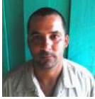
Por: Raichel Barrios Cubano de a pie