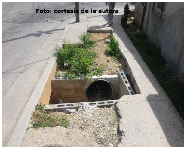
Hueco peligroso en la transitada Alameda

"De pensamiento es la guerra mayor que se nos hace, ganémosla a pensamiento".