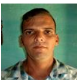
Alexander Sánchez Cubano de a pie

Pinar del Río. En ruinas y a la espera de una reparación, continua, después de 8 años, la tienda El Oeste.