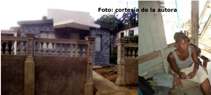
Diferencias entre las casas de los que viajan y los que no

Pinar del Río. Reiterado maltrato por parte del personal de enfermería del policlínico Turcios Lima, tomando como pretexto, nuevas medidas para reestructurar el trabajo.