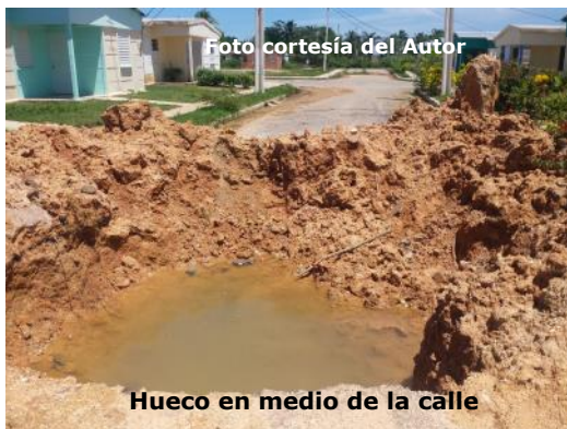
Hueco en medio de la calle

Cuando el agua comenzó a brotar debajo de la calle, Lázaro, delegado de la circunscripción y trabajador de acueduc-