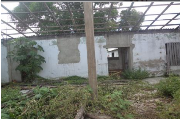
Vistas del local abandonado

“De pensamiento es la guerra mayor que se nos hace, ganémosla a pensamiento”.