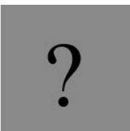
Caridad Loases Cubana de a pie

Pinar del Río. El estado deplorable de las calles hace que los vecinos protesten aún sabiendo de que nada se resuelve.