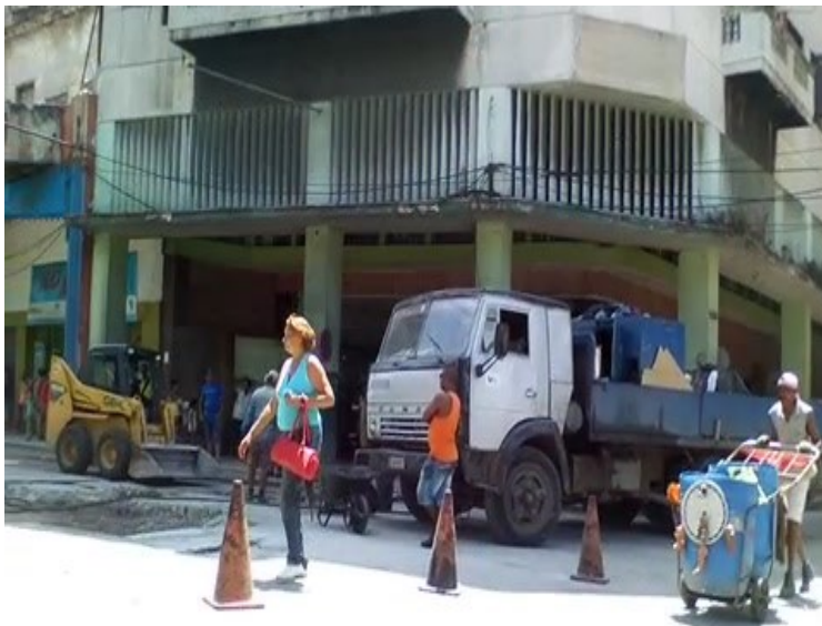
Imagen de la obra abandonada que retoman el gobierno

Tras reiteradas quejas de los habitantes de la calle de Monte esquina Águila, el gobierno municipal retomó el pasado 6 de agosto la reparación de esa concurrida vía que brinda acceso al centro de la capital. La obra había sido aplazada durante tres meses, según un trabajador de la empresa provincial de viales, por la falta de materiales necesarios para la reparación vial. La obra estaba planificada para terminarse en dos días pero inesperadamente se convirtió en una larga y tortuosa espera que facilitó la acumulación de aguas albañales y la proliferación de un micro vertedero en la esquina de la calle águila.