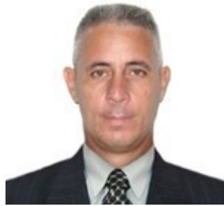
Por: Alejandro Hernández Cepero Periodista ciudadano