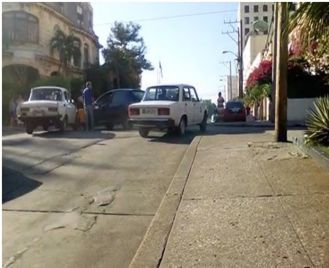
Imagen en el momento del accidente

Un accidente de tránsito entre un auto particular marca Moskvich y un auto estatal marca Renault perteneciente a la empresa de comercio Tiendas