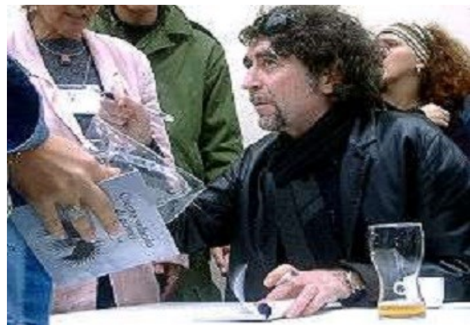
Imagen del Cantautor Joaquín Sabina.

El cantautor, poeta y pintor español considerado como una de las figuras más destacadas de la música contemporánea, aseguró que, “luego de constatar el desarrollo patético que han tenido en todo sitio, ya no sabe si volver a creer en las revoluciones”.