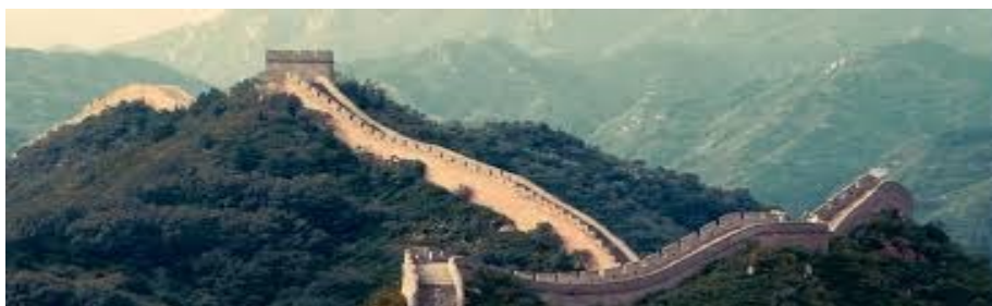
Imagen del paisaje de China.

Según la Oficina Nacional de Estadísticas e Información (ONEI), por el momento el tercer socio es España con una utilidad en sus operaciones comerciales que rebasan los 1 300 millones de dólares”. Datos ONEI.