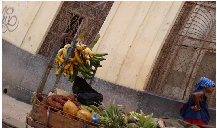
Productos del agro, con precios que están por las nubes y desangran el salario mensual de los cubanos.

El costo de la vida es sumamente elevado al igual que la electricidad y todo lo que venden en las llamadas tiendas recaudadoras de divisas, una gran gama de productos y