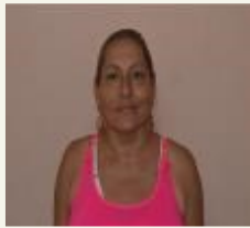
Por: Ada María López Canino Periodista ciudadano