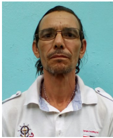
Por: Bárbaro Pérez Cubano de a pie