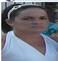
Por: Danay Canals Periodista ciudadano