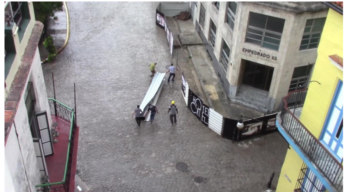
Ciudadanos cargando fibras de cinc

“Los cuentapropistas damnificados realizarán los pagos establecidos, mediante bonificación, efectivo, crédito bancario, la combinación de estas modalidades o subsidio”. Comentó un funcionario del Ministerio de Finanzas y Precios que no quiso ser identificado.