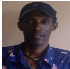
Por: José Ignacio Martínez Periodista ciudadano