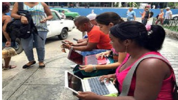
Usuarios de la red wifi, beneficiados con las nuevas tarifas

Un comunicado emitido por (ETECSA) fechado este 30 de octubre y publicado en la página web de la misma, anunció la rebaja de la tarifa de conexión para los servicios de navegación internacional del portal cubano Nauta. A partir de la fecha anunciada la tarifa oficial, será de 1.00 cuc (25.00 pesos mo-