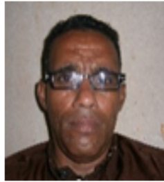
Por: Julio A Rojas Periodista ciudadano

"actividad institucional que tiende a cohibir los comportamientos colectivos". En esencia, la represión consiste en "la acción de gobierno que discrimina brutalmente a personas o a organizaciones que se considera que presentan un desafío fundamental a las relaciones de poder existentes o las políticas clave de la administración".