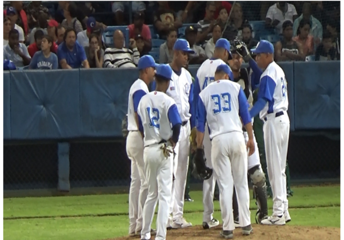
Imagen del equipo de Industriales