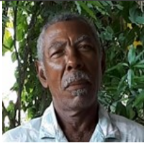
Por: Luis Jesús Gutiérrez Cubano de a pie