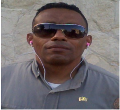
Por: Julio A. Rojas Cubano de a pie.

En reunión de balance anual del Ministerio de Industrias cuya versión se transmitió por la TV estatal (única permitida) el designado presidente Miguel Díaz-Canel admitió que se han dejado de producir múltiples renglones de uso común de la población que hoy se importan casi en su totalidad. Al respecto mencionó como ejemplo los zapatos Amadeo. Este calzado masculino gozaba de gran aceptación entre los cubanos, junto con otra marca nacional, Ingelmo, y una gran variedad que se producían en pequeñas instalaciones, las cuales bautizó Fidel Castro como “chinchales” al momento de su estatización en 1968.