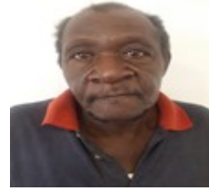
Por: Manuel Aguirre Labarre Cubano de a pie