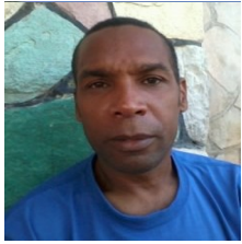
Por: Sergio Estrada Girat Cubano de a pie

La Habana, ICLEP). El equipo del municipio Arroyo Naranjo se convirtió en el nuevo rey del béisbol capitalino, tras vencer cuatro carreras por una a la novena de 10 de Octubre.