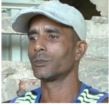
Por: Yuniór González Rosabal Cubano de a pie