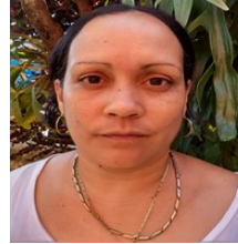
Por : Yunia Figueredo Cubano de a pie