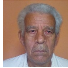
Por: Modesto Hernández Herrer Cubano de a pie.

La Habana (ICLEP). Grupo Empresarial Correos de Cuba (GECC) congeló los cobros de giros internacionales. La interrupción, generada por afectaciones en la recepción de efectivo desde la Unión Postal Universal (UPU), fue justificada por supuestos problemas de conectividad.