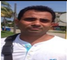
Por: Enrique Díaz Rodríguez Cubano de a pie