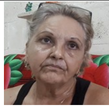
Por: Julia E. Aramburu Cubano de a pie.