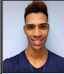
Por: Alexander Vaillant Guerra Cubano de a pie

De acuerdo con Loyola, los agentes policiales acompañados por la presidenta del CDR (Comité de Defensa de la Revolución), en condición de testigo, revisaron el domicilio y ocuparon varias jabas con “tiras de pastillas en su interior”.