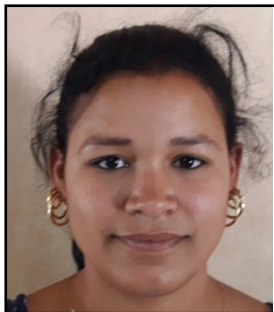
Por: Dalianis Rubí Quesada Cubana de a pie