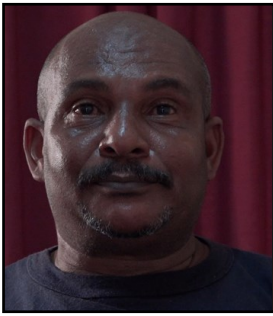
Por: Abel Carrión Kindelán Cubano de a pie