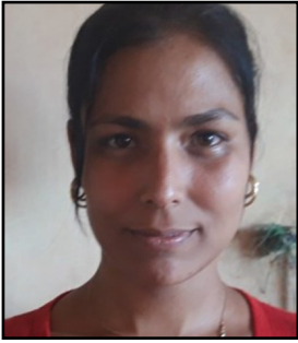
Por: María Luisa Sánchez Esquivel Cubana de a pie