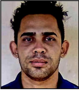
Por: Ignacio Ramos Moncada Cubano de a pie