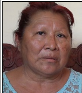
Por: Deysi Acuña Fernández Cubana de a pie

El céntrico parque, al caer el sol se convierte en un lugar peligroso. Delincuentes al asecho, mendigos acampanado y alguna que otra pareja haciendo el amor, destierran de la glorieta cualquier vestigio religioso.