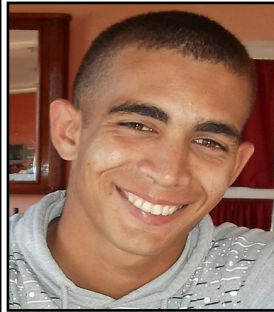
Por: Maikel González Báez Cubano de a pie

“Si no compras la pipa olvídate de agua. Tienes que tener 20 fulas a mano si quieres resolver”, dijo Aguirre.