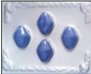
En el mercado negro, un pack de cuatro viagras equivale al salario mínimo básico de un trabajador estatal del sector gastronómico.

“En la calle hay mil gentes vendiendo esas pastillas, los cogieron porque se pusieron fatal”, sentenció Almaguer.