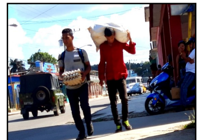
Cargados de alimentos, los revendedores recorren los barrios. Para muchos son el salvavidas del día.

Sin embargo, Olga Solís Galván, en 10 de Octubre señala que los precios más que una ganancia para vivir son una multa que la mayoría de las personas no pue en pagar.