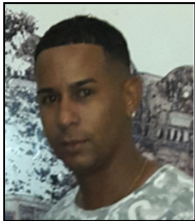
Por: Darío Reyes Montero Cubano de a pie