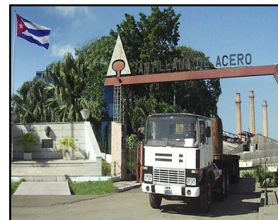
La Antillana de Acero recibe una inyección de capital ruso (Foto tomada de Internet).

Sin embargo, la entrada de capital proveniente de Rusia