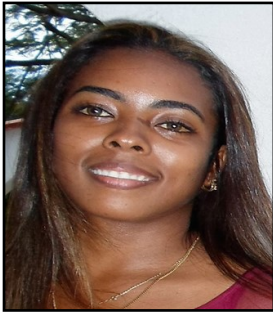
Por: Yanetsi Portales Rivero Cubana de a pie