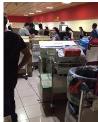
Caos en la Terminal 3 del Aeropuerto internacional José Martí.

"Nos dicen que somos unos bandidos, que venimos a