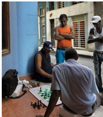
Personas juegan ajedrez en la calle.

"Ya no se puede ni jugar ajedrez en este país. Pero tampoco nos dan un local para jugar sin molestar a nadie, lo de la policía es joder", dijo Gómez.