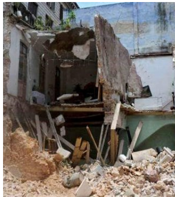
Al menos cinco derrumbes han tenido lugar en La Habana durante el 2019.