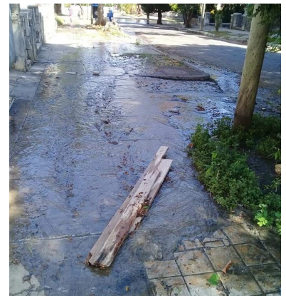
Aguas albañales en la calle 25, Marianao.

“De camino a llevar el niño a la escuela tuve que regresar porque al final de 114 un automóvil nos salpicó de aguas albañales, comenta Vivian Socarrás.