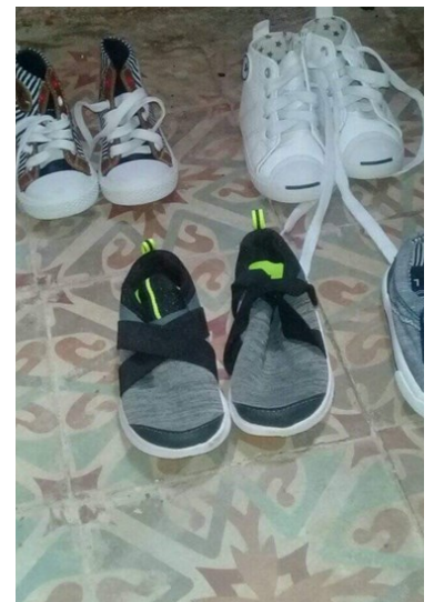
Las personas prefieren comprar calzado infantil en el mercado negro.

“En la tienda no sirven, lo barato sale caro”, dijo Pedroso.