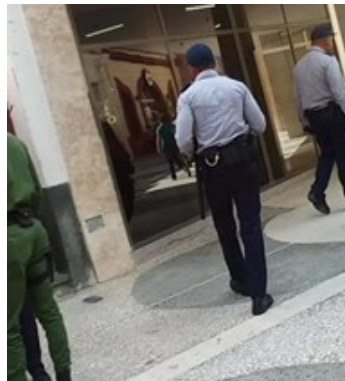
Fuerzas represivas cargaron contra los revendedores del boulevard de San Rafael.