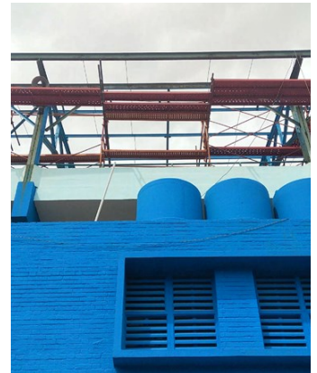
Los techos del estadio en varias zonas permanecen sin cubierta.