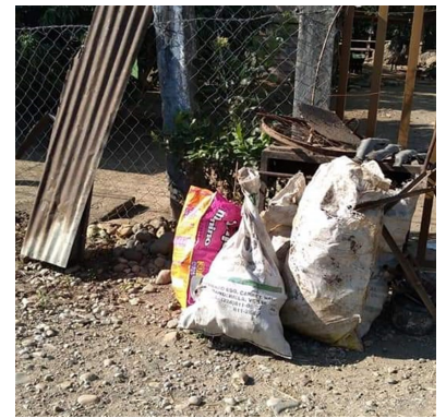
Los basureros y micro-vertederos son caldo de cultivo para los criaderos de mosquitos.