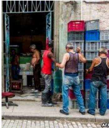
Los alimentos escasean en toda la ciudad, donde muchas personas viven de la cuota mensual.

"Cuando comenzó la venta aparecieron las mismas "negronas" y tuve que decirle a mi marido: o pones cara de malo, o los niños hoy no comen arroz", comentó Pimentel.