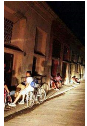
Los apagones hacen que las personas abandonen la cuarentena.

“No sabes si puedes cocinar o no, porque si lo haces temprano se te echa a perder la comida con los calores que están haciendo, y si lo dejas para su horario normal, corres el riesgo de que se vaya la corriente”, destacó Izaguirre.