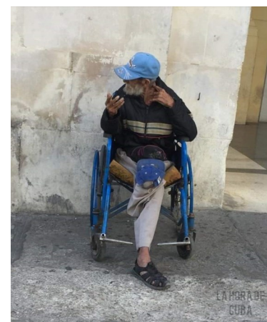
Asolados por la falta de atención en plena pandemia, los discapacitados comienzan a deambular por las calles.

"En realidad lo único que tiene garantizado es la comida en el comedor de los viejitos y como no pueden salir, tampoco comen si la gente no se conduele y les lleva el plato de comida a la casa", acotó Paulo Velázquez, vecino.