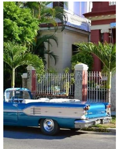
Barriada El Sevillano, en 10 de Octubre, donde han ocurrido reiterados robos con fuerza.