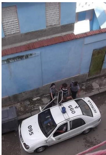
Mientras ocurren numerosos robos en la ciudad, la policía persigue a las personas sin nasobuco.