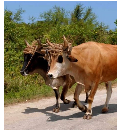
El robo de ganado en Arroyo Naranjo va en aumento.