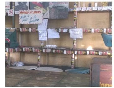
Bodega El Aeropuerto.

El número de afectados hoy por esta violación ascienden a más de 8000 núcleos.