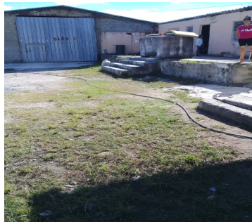
Almacén de la UEB.

Este funcionario ha establecido un negocio familiar en esta entidad, para cubrir la corrupción existente, colocando como trabajadores a su padre, suegro, primo y a un guardia que garantiza la salida ilegal de los materiales.