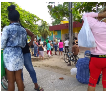
Cola para cerdo.

De igual manera la cerveza, tan cotizada no aparece y cuando lo hace es en las tiendas en moneda libremente convertible, donde las colas son interminables.