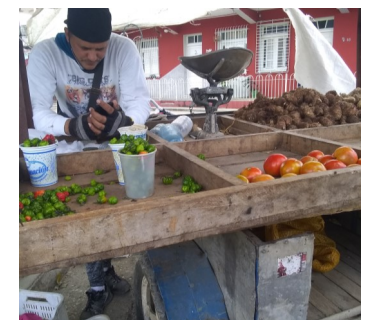
Punto de venta.

Pese a que en días recientes la gobernadora provincial hiciera un llamado al control de los precios por parte del cuerpo de inspectores, las violaciones continúan y el pueblo es quien sufre las consecuencias de tales violaciones.