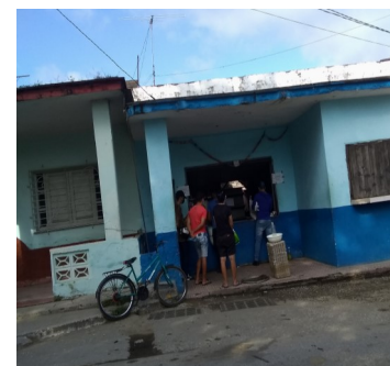
Bodega local.

El engaño a los consumidores se continua manifestando de manera continuada, cuando el pasado 18 de Diciembre a otro grupo de bodegas solo se le asigno dos huevos de los cinco adicionales hasta ahora ofertados.