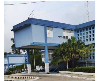
Estación PNR: Foto ICLEP

Antes del cierre de esta nota otra queja similar llegó a la sede de medio mediante un familiar de un detenido en esta unidad.