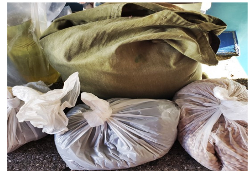
Alimentos para un mes de 5 personas

Pinar del Río es un municipio mayormente agrícola donde una buena parte de las personas son campesinos sin ingresos económicos fijos.