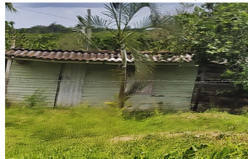
Vivienda de la madre: Foto ICLEP

Este es un ejemplo claro que desmiente una vez mas las patraña del Presidente Miguel Díaz Canel, de que en Cuba no quedará nadie desamparado ante el ordenamiento monetario, sin embargo casos desatendidos como este se sobran en cada uno de los rincones del país.