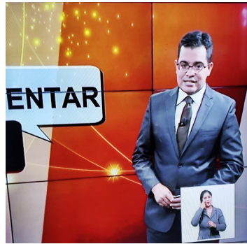
Periodista oficialista

A raíz de estas críticas el régimen se vio forzado a analizar los precios impuestos a varios servicios y productos.