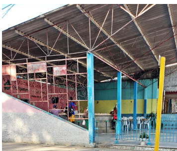
Comedor de ancianos

Alejandro Gil viceprimer ministro y titular de Economía y Planificación aseguró que los nuevos precios de los alimentos estaría en correspondencia con el salario mínimo garantizando el bien de todos con el ordenamiento monetario, pero esto no ha sido cierto.