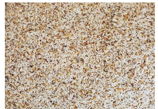
Arroz de la bodega

Desde que comenzó este año 2021 los precios a los productos de la canasta familiar se elevaron por encima de las 10 veces respecto a su valor anterior.