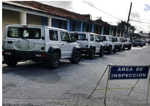
Área de inspección: Foto ICLEP

Para los tramites legales en las oficinas del gobierno cubano el nacional siempre ha sido la segunda opción.