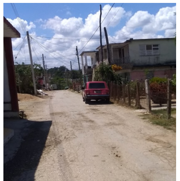
Barrio Santa Cruz.

Pese a que en días recientes, la gobernadora provincial llamaba a la población a observar los protocolos de seguridad, es el propio personal médico el principal infractor de los mismos.