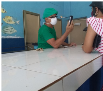
Pescadería del Paseo.

Mientras que el número de quejas aumenta contra los centros de elaboración y venta de alimentos, la mala calidad de los alimentos continua y nada pasa.