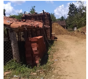
Tejar de Mirtha.

Pese a que la Dirección Provincial de Trabajo dice que hay un aumento de las personas incorporadas al trabajo, las opciones para muchos jóvenes son escasas: agricultura y la construcción, de ahí que sean explotados en los mencionados tejares.