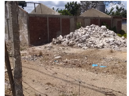
Obra paralizada.

Los altos precios impuestos por la tarea ordenamiento a los materiales de la construcción han provocado que más del 80% de los mismos solo sea posible hallarlos en el mercado negro.