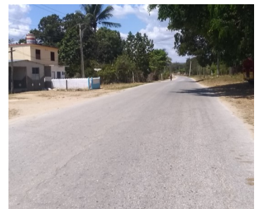
Jíquima de Peláez.

La única vía de transporte disponible hoy para esta comunidad la constituyen los ómnibus de Yaguajay, que dan dos viajes al día.