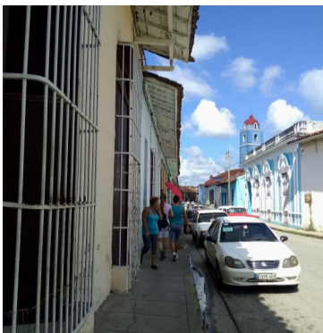
Capital provincial.

El colapso de la economía espirituaña se ha sentido con mayor fuerza en las personas de la tercera edad y desempleados.