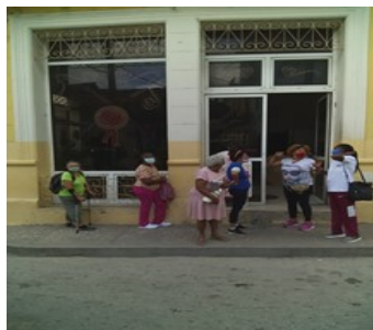
Casilla especializada.

El desabastecimiento de estos comercios, obliga a muchos a tener que pagar precios abusivos en el mercado negro local para alimentarse.