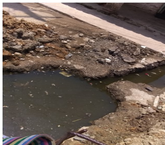
Hueco sin tapar.

La situación de los salideros requiere hoy una intervención rápida del régimen, si se tiene en cuenta los problemas que tiene la capital con el abasto de agua.