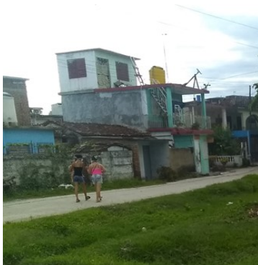
Reparto Escribano.

“La situación con el agua es bien complicada en varios lugares de la ciudad, pues no hay combustible”, aseguró Damián Quintero funcionario de Acueductos.