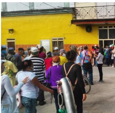
Panadería La caridad.

Esta nueva limitación recrudescerá aun más la actual crisis alimentaria que se vive en la provincia.