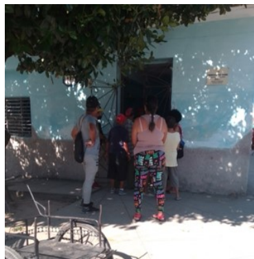
Farmacia Local.

En los momentos actuales están en falta 15 de los medicamentos normados por el tarjeto.