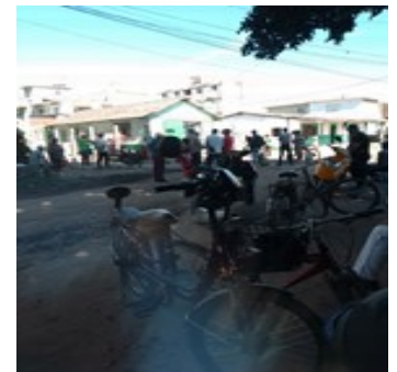
Cola para el gas.

En el resto de los municipios de la provincia, con más de 9 mil contratos del producto, según registros de la Empresa Provincial del Gas, del pasado 12 de mayo, la situación se hace más compleja.