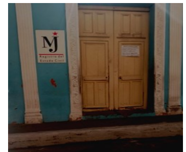
Registro Civil.

Pese a las modernizaciones realizadas al sistema de estas entidades, los problemas de atrasos continúan afectando a la población.