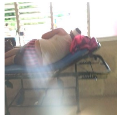
Joven asaltado.

Este escenario tan violento, se viene desarrollando desde finales del pasado año y ha sido denunciado por El Espirituano, en las ediciones de febrero y marzo.