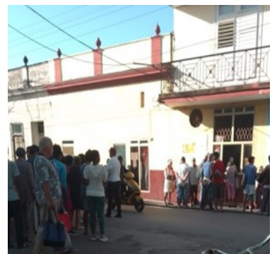
Panadería Local.

Pese a los altos precios, la poca oferta de alimentos provoca largas colas de personas frente a las cuatro panaderías especializadas que ofertan este pan, cuya venta apenas dura un par de horas.