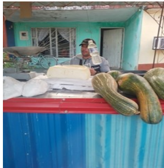
Punto de venta.

"No podemos bajar los precios del queso, pues al comprarlo al productor nos sale cara la libra, y tenemos que sacar la inversión", refirió Misael Fundora, comerciante de punto de venta de Kilo 12.