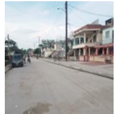
Sancti Spíritus.