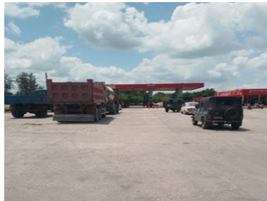
CUPET local.

Norgel Ramos, administrador del CUPET de Garaita, aseguró al medio que la medida no es totalmente efectiva, pues su aplicación en la capital del país no ha dado los resultados esperados.