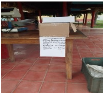
Punto de Venta de Villa Rosalba.

Fernando Carballo, dependiente de Villa Rosalba asegura que estos precios se deben a la necesidad de garantizar los ingresos y salarios de los trabajadores.