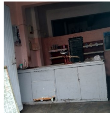
Bodega Local.