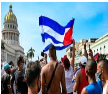
Manifestaciones por el cambio.

Se ha convertido en una necesidad para sobrevivir y buscar desarrollarnos económicamente, eliminar el sistema impuesto. Ya no puede ser solo una opción. Es el momento de desterrar el pensamiento imperante y actuar como lo exigen los tiempos nuevos. Cuba necesita un cambio porque se muere nuestra gente.