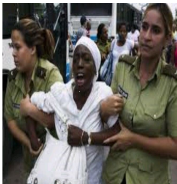
Violencia policial.

El fin de la violencia en Cuba, implica un cambio político.