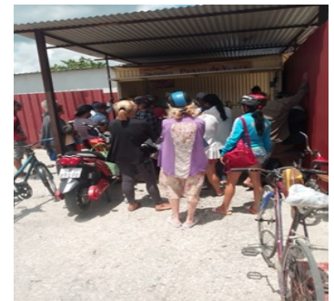
Punto de venta El Chambelón.

La poca oferta de este producto obliga a los espirituanos a comprarlo a comerciantes privados, por un valor de 800 pesos el pomo.