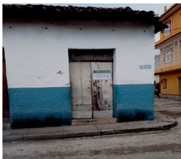
Tienda La Nevada.