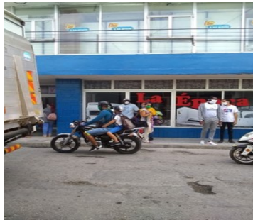
Tienda en MLC.

Beatriz Lunas, trabajadora del Mercado del Boulevard, asegura que los problemas con la falta de conectividad, se originan en el sistema, por lo cual resulta molesto al cliente pero les limita a ellos las ventas diarias.