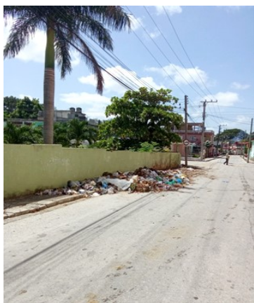
Reparto de Colón.

El índice de infestación de la enfermedad en la capital espirituana es hoy de 0,97 casos por cada mil habitantes, según informa Ruiz Santos.