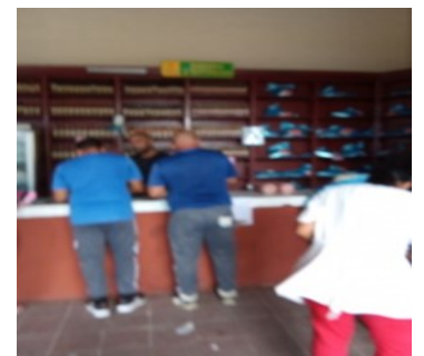
Mercado El Convenio.

Según estudios realizados en Cuba sobre conectividad, existen 7,2 millones de líneas activas y de ellas solo 6 mil acceden al internet, condición esencial para usar las aplicaciones.