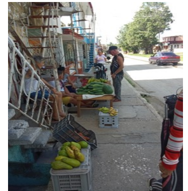
Calle de Kilo 12.