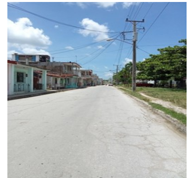
Capital provincial.