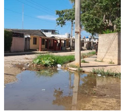
Hueco ubicado en la calle 25.

Otro apunte de los vecinos, el ecosistema insano del hueco es tan prolífero en asquerosidad que en determinadas zonas de se pueden advertir colonias de gusanos. “Se los digo con toda franqueza, el hueco de la esquina ya es parte de la familia. El día