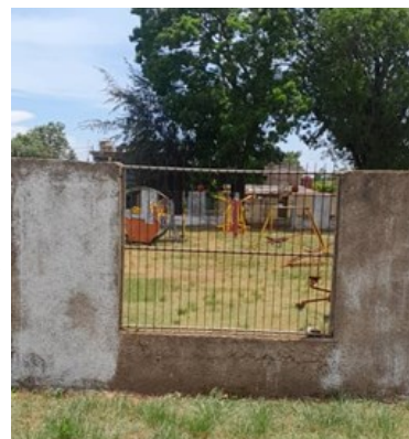
Parque Infantil.