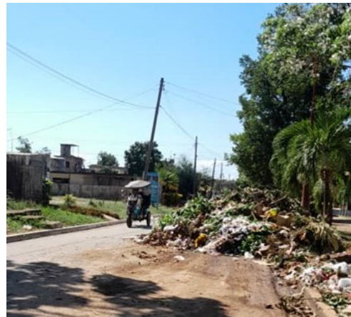
Basurero en la Avenida.

basura en la calle era solo cosa de los barrios periféricos, de nosotros la gente de orilla; pero no, la céntrica Avenida artemiseña parece un chiquero”.