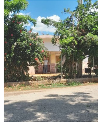
Escuela Juan Pedro Carbó, ubicada en la calle 23 .

Por su parte, Úrsula Reo Díaz, personal de apoyo en la cocina, quien reside en el reparto Toledo, señaló a los corres-