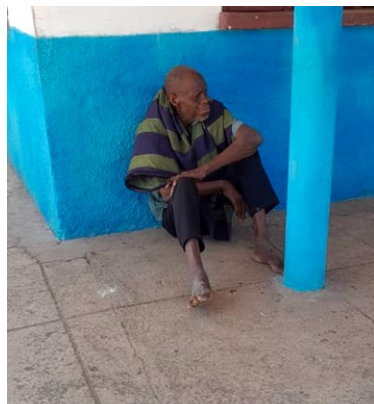
Indigente.