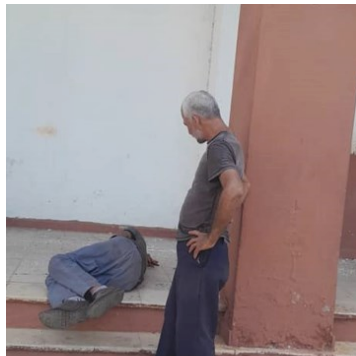
Indigente Muerto.

La noticia de este fallecimiento en la vía pública de nuevo ha puesto sobre el tapete la desprotección a la que está sujeta este creciente sector social. En tanto, los debates ciudadanos se centran en la no presencia del régimen o presencia disminuida en el fenómeno de la mendicidad.