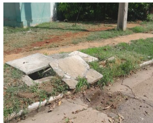
Registro.