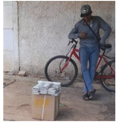
Vendedor.