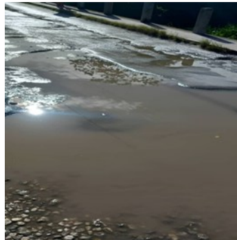
Aguas Albañales.

“Para resolver el problema se necesita una excavadora o contratar personas para que hagan el trabajo manual y no tenemos presupuesto para eso”, aseguró.