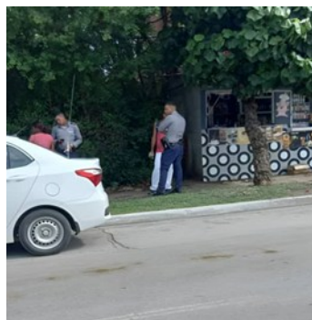
Agentes de la PNR.