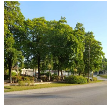
Reparto Condado.

“Hace sólo dos semanas vinieron seis guaguas con un pequeño grupo de personas hasta el Monumento del Tren Blindado, a entregarle el carnet del PCC a ocho ciudadanos que viven en los municipios de Camajuaní y Remedios. Para eso sí apareció el combustible”, significó la señora de Armas Carrión.