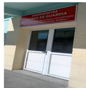
Cuerpo de Guardia.

“Los sanitarios estaban sucios y con agua en el piso porque a las personas se les derraman esas cubetas. El Estado debe priorizar esos lugares y garantizar los recursos que se necesitan para mantenerlos funcionales”, alertó León Fundora.