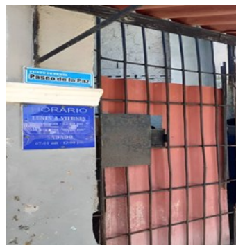
Punto de venta.

“El Estado debe garantizar ese producto en todos los barrios de la ciudad, porque la población necesita realizar la desinfección de sus casas para evitar muchas enfermedades. Ahora solo lo están vendiendo los revendedores a un precio que nosotros no podemos pagar”, alertó.