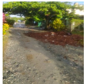
Callejón Diepa.

ron apoyo al Gobierno Provincial para arreglar el callejón y hasta el momento no han recibido respuesta sobre ese pedido.