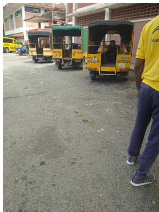
Terminal de Ómnibus en Pinar del Río

El Estado cubano, al no proporcionar alternativas accesibles ni soluciones concretas a esta crisis, sigue siendo responsable de la asfixia económica que sufren los ciudadanos. Las autoridades han fallado en garantizar un transporte asequible, agravando las dificultades diarias de los trabajadores, estudiantes y enfermos. Mientras tanto, el ciudadano de a pie sigue sin respuestas claras y sin a quién recurrir para exigir sus derechos.