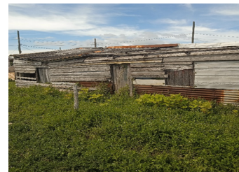
Vivienda en mal estado en La Coloma

Mientras el pueblo vive en pésimas viviendas, muchos de ellos en condiciones de calle, el Estado continúa construyendo hoteles para el disfrute de turistas y de ellos mismos en compañía de sus familiares.