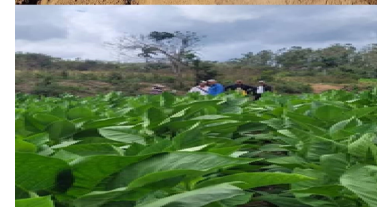
Vega de tabaco en el municipio San Luis.