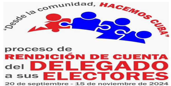
Logo del proceso de rendición de cuentas.

Estas asambleas deberían ser para que los dirigentes gubernamentales den respuesta a los problemas reales de nuestra sociedad civil, para explicarle al pueblo qué medidas está tomando el Gobierno para enfrentar la precaria situación que se vive. Sin embargo , la realidad es otra , cada día que pasa el pueblo se plantea más preguntas y obtiene menos respuestas , el Gobierno en Pinar del Río tiene 65 años de problemas sin resolver que se han ido acumulando , problemas que van desde la forma de gestión hasta los mismos gobernantes, porque el principal y mayor problema ya el pueblo lo conoce.