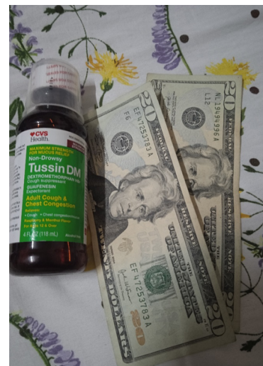
Valor del medicamento

El pueblo de Cuba, cuyo Estado se autoproclama a nivel internacional potencia médica y uno de los mejores sistemas de Salud del mundo, sucumbe ante una simple pulmonía. El Gobierno solo paga una media salarial de 2 100 pesos, que para el cubano de a pie que no tiene otra entrada de dinero en su hogar, no alcanza para la adquisición de los productos básicos de alimentación y aseo, menos para costearse los medicamentos.