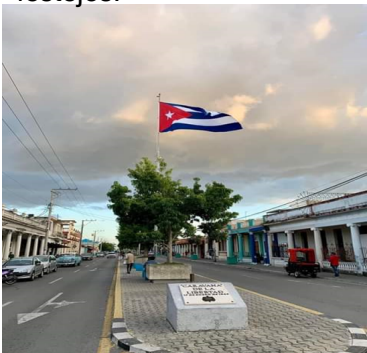
Imagen de la entrada a la ciudad pinareña

Las inconformidades del pueblo se hacen notar por doquier , los pinareños no entienden cómo es que se originan tantos gastos , si sus ciudadanos están sumergidos en una miseria tan precaria, gastos que se invierten en un festejo que solo disfrutaban unos pocos . Y aun sin concluir el día ya los dirigentes están pensando en los próximos festejos.