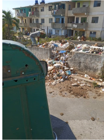
Basurero en el municipio San Luis

pero los intereses del pueblo no son preocupación. Mientras tanto la población se pregunta: ¿Qué hago con mi basura?