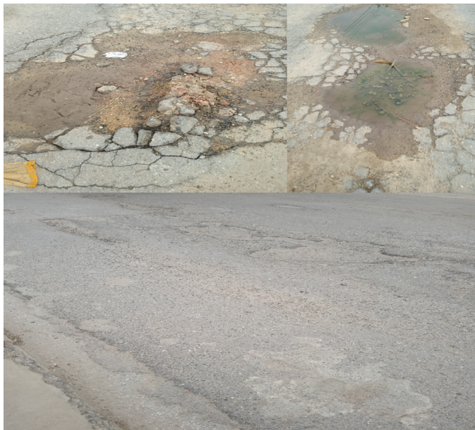
Baches en carretera pinareña

Pero mientras esto pasa nuestros niños continúan recibiendo clases de mala calidad por la falta de medios de enseñanza , otra vez el gobierno demuestra que "retrocedemos victoriosos".