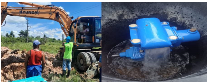
Trabajadores de Acueducto

agua solamente una vez al mes, eso siempre que no se rompa el motor, la otra solución es comprar una pipa, pero como se hace imposible llegue a mi casa, tengo que hacer uso de tanques y medios alternativos". Esperemos que la situación se resuelva en solo unas horas y no se convierta, como de costumbre en nuestra provincia, en algo de meses, o inclusive años.