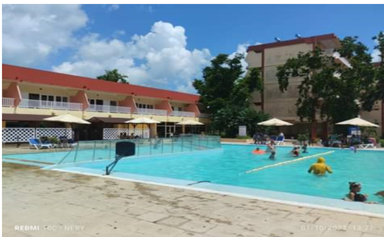
Hotel Pinar del Río

La negativa del personal del hotel a dar declaraciones dejó una brecha a las incertidumbres, ante las serias deficiencias que presentan, a pesar de sus altos precios.