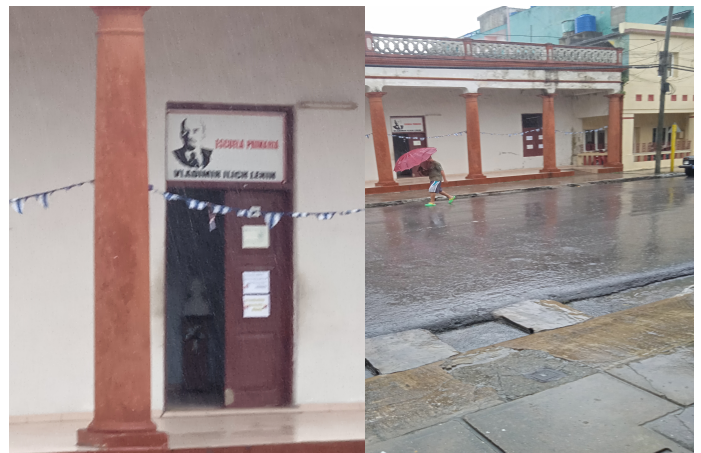
Escuela primaria Vladimir Lenin