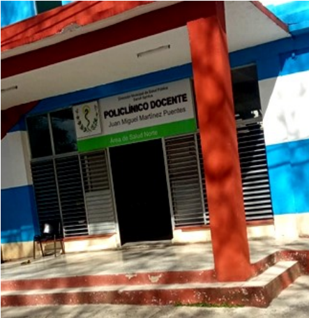
Policlínico norte.