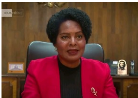
Ministra presidenta del Banco Central de Cuba durante una intervención oficial.

En un país donde las fuerzas productivas permanecen asfixiadas por un sistema de relaciones de producción controlado y distorsionado por un modelo político e ideológico agotado, resulta imposible que cualquier proyecto o medida económica logre resultados favorables. Es doloroso reconocerlo, pero bajo el actual régimen cubano no existen condiciones reales para implementar cambios o mejoras que dignifiquen la vida de la población y respondan verdaderamente a sus necesidades.