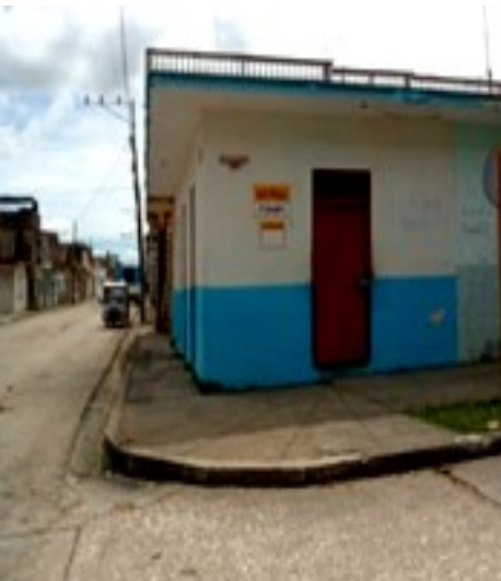
Bodega local.