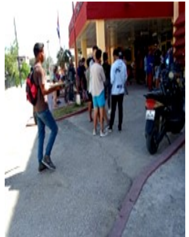
Banco local.

cubano, está condenada al fracaso porque no va a la solución de las causas reales que generan la inflación y devaluación del peso cubano.