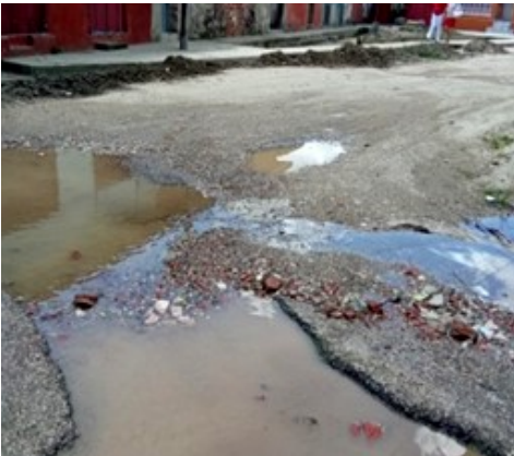
Calle Bayamo.

Orbelys Camacho Quintanas, funcionario de la Empresa Municipal de Viales en el municipio de Sancti Spíritus, reconoció ante este medio que el deterioro de los viales constituye hoy un problema de difícil solución en la ciudad, debido a la falta de combustible para poner en funcionamiento la planta de asfalto de El Chambelón, recurso indispensable para la reparación de las calles.