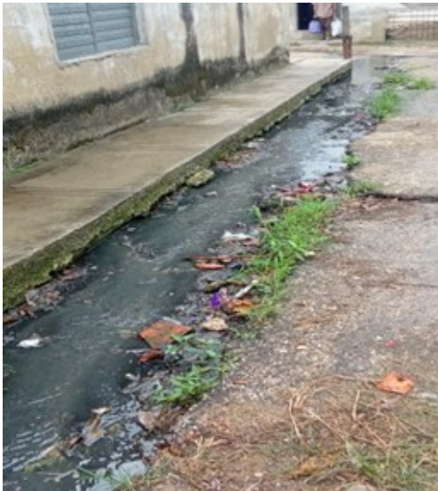
Fosa desbordada en la calle Paraíso vierte aguas residuales, poniendo en riesgo la salud de los vecinos.