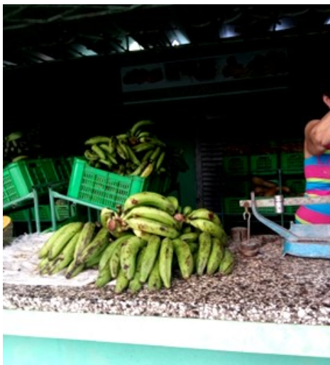
Mercado local.