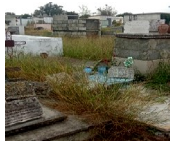
Cementerio espirituario.

El antiguo proyecto aprobado por las autoridades provinciales para la ampliación del cementerio de Sancti Spíritus parece haber quedado en el olvido, sin avances visibles ni respuestas concretas a una problemática que continúa agravándose.