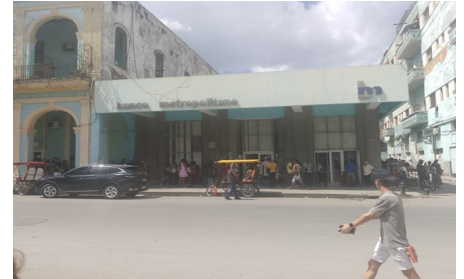
Banco Metropolitano, Centro Habana.

Los usuarios consideran que el banco es uno de los espacios donde la protección al consumidor está ausente, sobre todo después de que dejaron de ser administrados de forma mixta por empresas foráneas. Para el cliente, el banco es un lugar que genera estrés y donde se pierde gran parte del día.