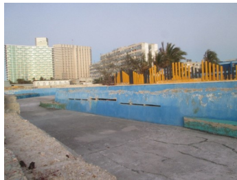
Piscina colectiva del centro recreativo Camilo Cienfuegos.

Uno de los grandes problemas que afecta a la familia cubana, y en especial a la juventud con bajos ingresos, es la falta de voluntad política del Estado en materia recreativa, un problema que aún no tiene solución.