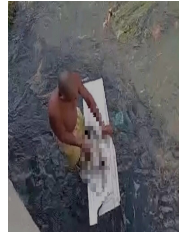
Hallazgo del cadáver de una bebé en La Habana.

Por ahora el silencio oficial es total. En el policlínico cercano, nadie ha querido declarar. Tampoco ha habido comunicados de la policía. Mientras tanto, en el reparto Martí los vecinos no olvidan. Han empezado a llamar a la pequeña “la angelita del río”.