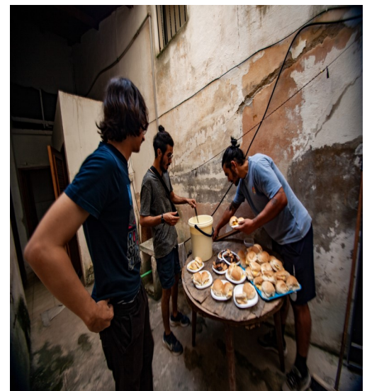
Jóvenes voluntarios preparan desayunos para los más vulnerables en La Habana.

Estos acontecimientos se generan por la labor de activistas cubanos en el terreno, como la reconocida activista Lara Crofts, y, por otro lado, la labor de las iglesias como espacio de refugio y alimentación.