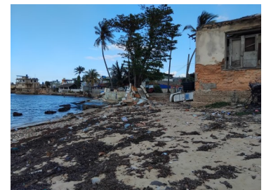
Vista de lo que queda del Club Playa, Jaimanitas.

"Pero ahora solo queda el recuerdo de lo que fue", aseguró finalmente Alberto, un viejo pescador que de niño acompañaba a su abuelo a la fonda del Club Playa.