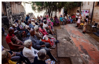
Ancianos reunidos en la Iglesia de San Francisco de Asís, La Habana Vieja.

El último encuentro terminó en una gran ronda que quedó marcada por la inmutable gracia del abrazo colectivo.