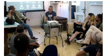
Espacio de cine Jueves de Boca a Boca, La Habana.

La presencia de una iniciativa como Jueves de Boca a Boca expande el panorama de exhibición fuera de los márgenes institucionales y permite conocer las más recientes producciones audiovisuales cubanas. Este proyecto constituye, además, una invitación al diálogo entre los cineastas que viven y trabajan en Cuba y un público ávido de ver cine cubano contemporáneo.