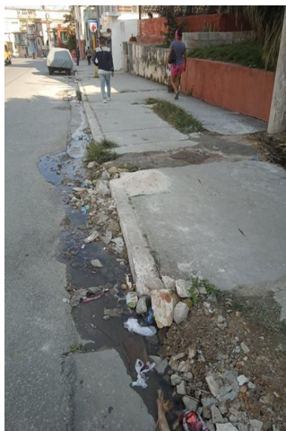
Derrame de aguas albañales alrededor de Sala de Rehabilitación de Luyanó.

Este foco de contaminación ha comenzado a generar un aumento de infecciones en el ámbito comunitario, y los vecinos exigen que se adopten de manera urgente las medidas necesarias para eliminar el derrame, sanear el área afectada y garantizar que la Sala de Rehabilitación funcione en condiciones adecuadas y seguras.