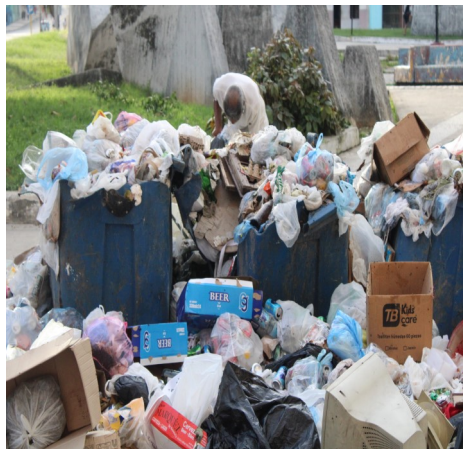
Basurero en La Habana Vieja.

Se habla, con razón, de la necesidad de elevar la conciencia ciudadana respecto a esta problemática. Sin embargo, este llamado no debe obviar las causas estructurales del problema, sino propiciar una reflexión colectiva: podríamos estar siendo cómplices del deterioro, entre vectores e inmundicia, de una ciudad que no solo nos pertenece, sino que forma parte del patrimonio humano.