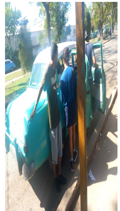
Punto de taxis particulares en el Paradero de Playa.

Un viaje en taxi desde el Paradero de Playa hasta Santa Fe costaba 10 pesos antes del reordenamiento económico. Luego pasó a 50 pesos y fue aumentando progresivamente hasta llegar a los 300 pesos durante el día, mientras que en la noche el precio depende de lo que establezca el conductor.