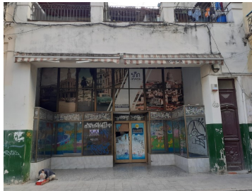
Juguetería Arcoíris, en La Habana Vieja.

Mientras emprendimientos del sector privado comienzan a florecer, estas tiendas, que en su momento formaron parte del patrimonio comercial de la ciudad, han perdido relevancia en el circuito económico debido a la falta de gestión y mantenimiento.