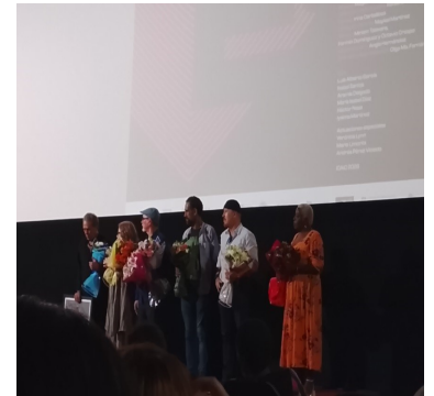
Presentación del filme cubano Estrés en el Cine Chaplin.

Estrés ofrece un retrato crudo y necesario de la realidad cubana. La mirada de su directora se centra en la vida de varias familias de distintos contextos. Sin embargo, lo que las conecta es que todas están atravesadas por la profunda crisis sistémica del país, que, desde la migración hasta la pobreza, dibuja un panorama angustiante y, por momentos, desolador.