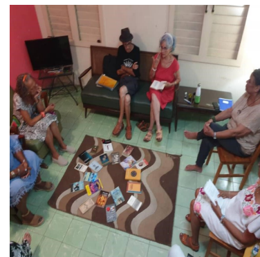
Participantes del proyecto en la ronda de lectura, La Habana.