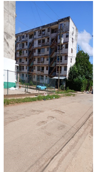
Edificio donde ocurrió el suicidio, reparto Abel Santamaría.

El aumento de suicidios asociados al consumo de drogas es un fenómeno en ascenso, pero en los medios oficiales el silencio también es parte de la crisis.