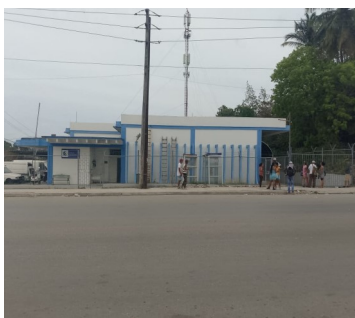
Oficina comercial de ETECSA, reparto La Cumbre, San Miguel del Padrón.