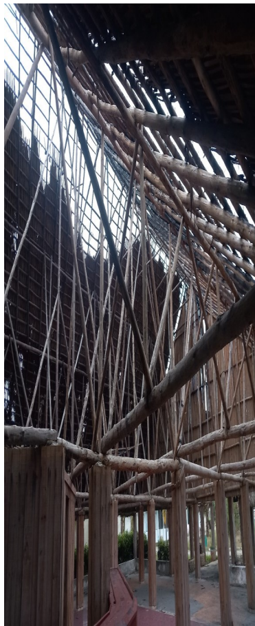
Techo quemado del ranchón del Círculo Social Aracelio Iglesias.

“Por la noche esto es una boca de lobo”, relató otro custodio, Abelito, quien estuvo de guardia durante uno de los robos. Según dijo, la policía intentó involucrarlo en el hecho, sin éxito. “Uno no puede arriesgarse a que lo maten por cuidar una instalación que el propio Gobierno ha dejado en completo abandono”, sostuvo finalmente.