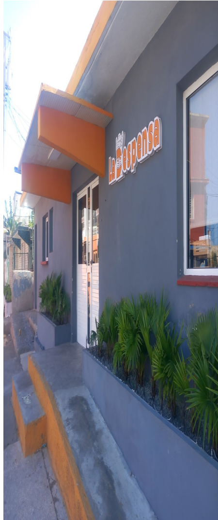
Mipyme La Despensa, en Jaimanitas.

Todos los experimentos han fracasado. Al pueblo cubano solo le queda la esperanza de que el Gobierno comunista sea derrocado por la fuerza de la nueva geopolítica, y el exterminio resolutivo de la actual administración de Estados Unidos de los regímenes totalitarios.