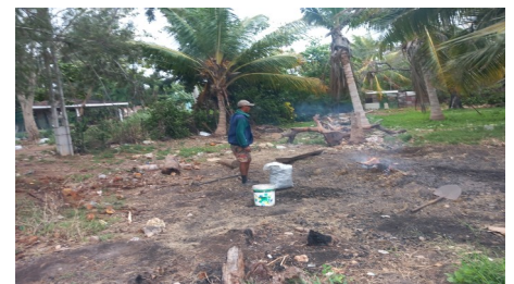
Lázaro Piedra en Querejeta.

Un vecino amigo de Lázaro lo animó a repetir la experiencia con su ayuda y repartirse el carbón. “Pero Lázaro no quiere saber más de hornos”, aseguró.