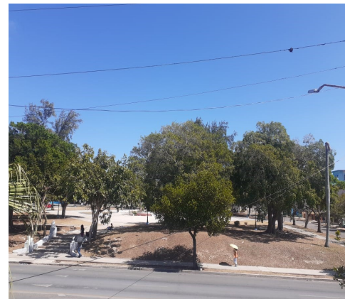
Parque Mariana Grajales, en el Vedado.

cepción de ausencia policial constituyen una preocupación creciente entre los residentes, sin una respuesta clara por parte de las autoridades.